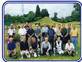
船橋地域支部との同コンペ ムーンレイクゴルフ倶楽部にて