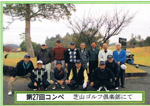
第27回コンペ 芝山ゴルフ倶楽部にて