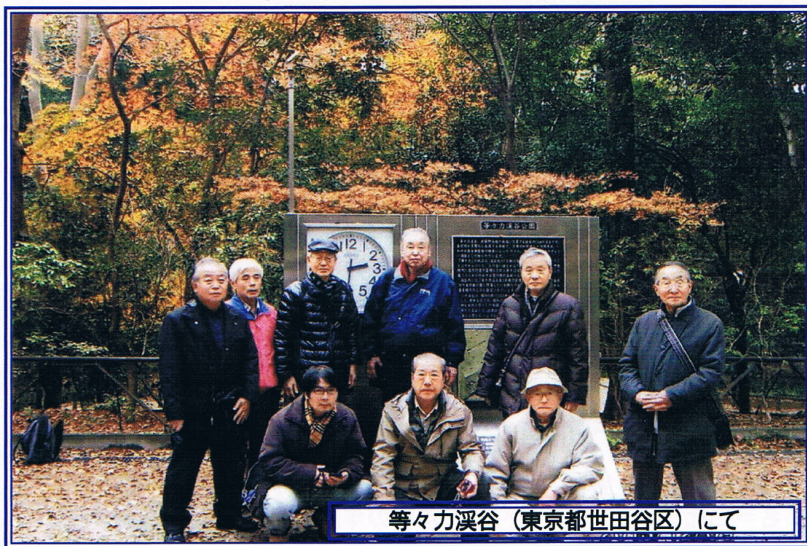
等々力溪谷 (東京都世田谷区) にて