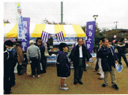
る役員全員は紫紺の法被「明治大学校友会市川地域支部」を纏っ

地震などの災害時には地域の結束が求められます。その重要性は日常のなかで再認識する必要で、市川地域支部も防犯ボランティア・パトロール等で地域に貢献しています。