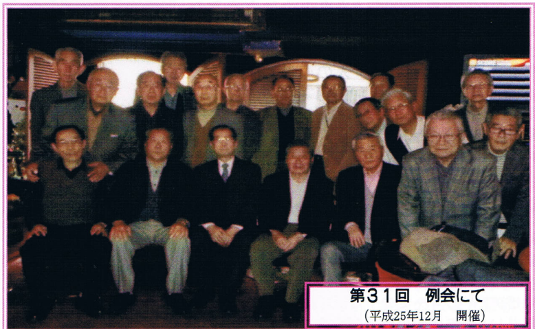
第31回 例会にて (平成25年12月 開催)